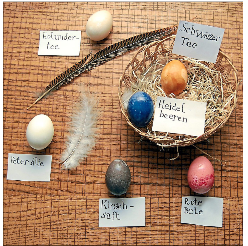
So sehen die Eier aus, wenn sie fertig sind.