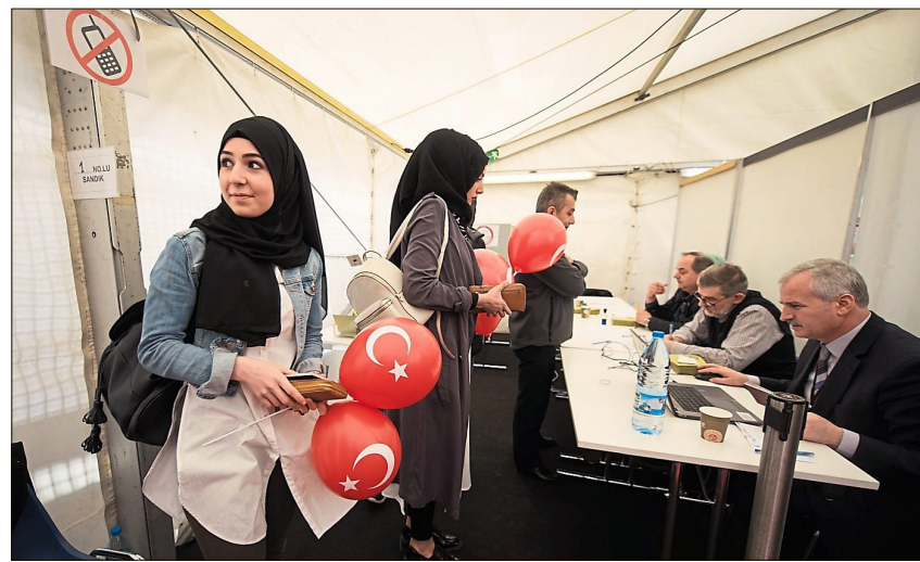
Menschen aus der Türkei durften am Montag bei einer Abstimmung mitmachen.

Wenn du mit der Farbe zufrieden bist, nimm die Eier heraus und lasse sie trocknen. Reibe sie anschließend mit etwas Speiseöl ab. „Das fixiert die Farbe und macht die Eier glänzender“, sagt der Experte.